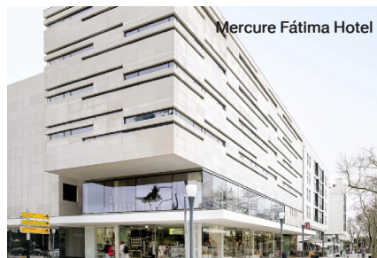
Mercure Fátima Hotel