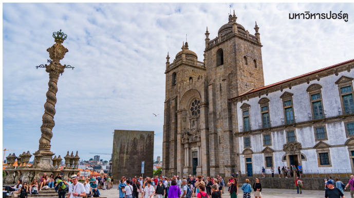
มหาวิหารปอร์ตุ