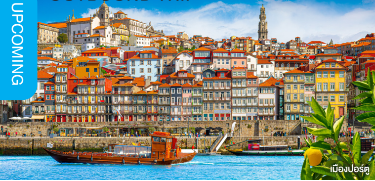
เมืองปอร์ตุ