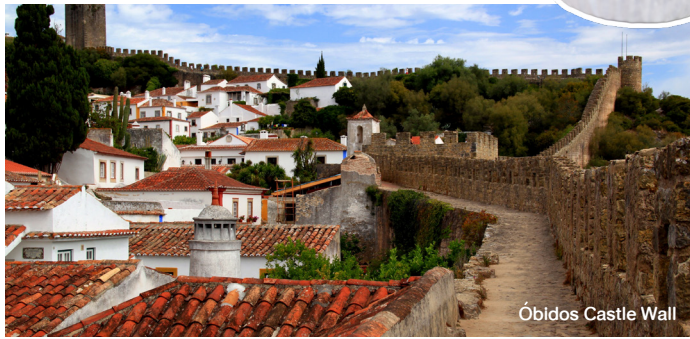
Óbidos Castle Wall