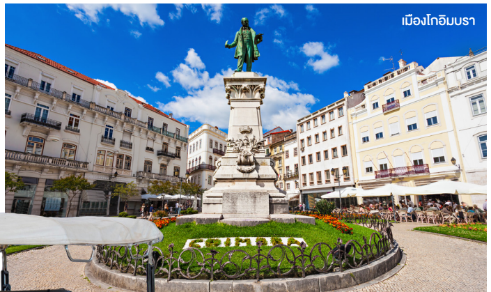
เมืองโกอิมบรา