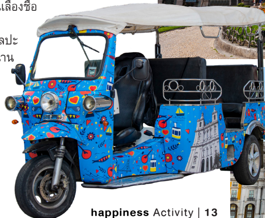
happiness Activity | 13

● ช่วงค่ำ รับประทานอาหารค่ำ ณ ภัตตาคารอาหารเอเชีย ที่พัก Hilton Porto Gaia Hotel หรือระดับเทียบเท่า