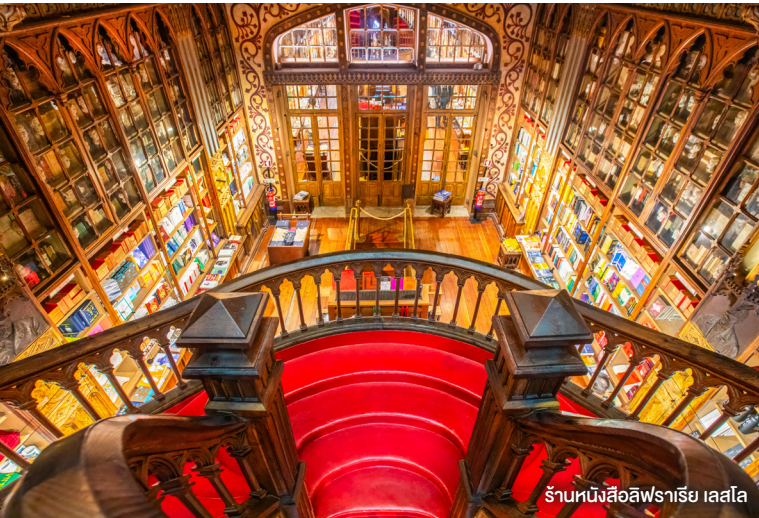
ร้านหนังสือลิวราเรีย เลลโล

จากนั้นเดินทางกลับสู่ กรุงลิสบอน เมืองหลวงของประเทศโปรตุเกส เป็นเมืองหลวงเก่าแก่อันดับสองของยุโรป ซึ่งเคยเป็นจุดเริ่มต้นของนักสำรวจที่ยิ่งใหญ่ที่สุดของโลกอย่าง เฟอร์ดินานด์ มาเจลลัน และเจ้าชายเฮนรีนักเดินเรือ เป็นเมืองที่เต็มไปด้วยความน่าหลงใหลและงดงามที่สุดแห่งหนึ่งของยุโรป ตั้งอยู่บนเนินเขาที่มีทิวทัศน์สวยงามจากทุกมุมมอง (ใช้ระยะเวลาประมาณ 2 ชั่วโมง 20 นาที)