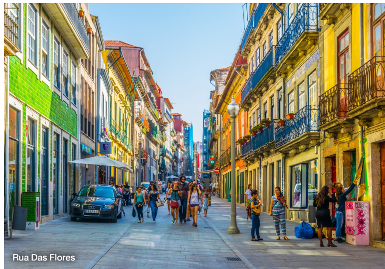
Rua Das Flores