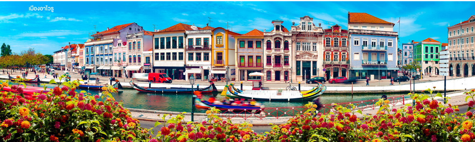
เมืองอาไวรู