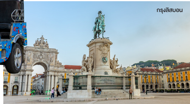
กรุงลิสบอน