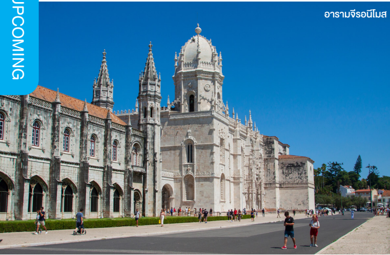
อารามจีรอนีโมส