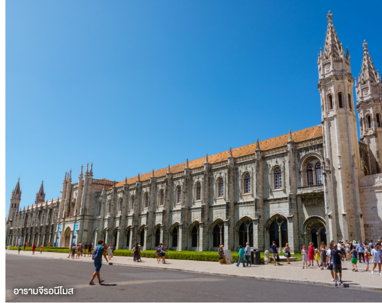
อารามจีรอนีโมส