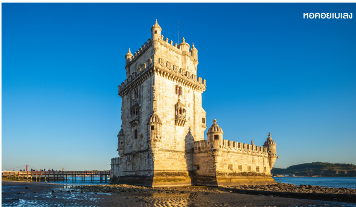
หอคอยเบเลง