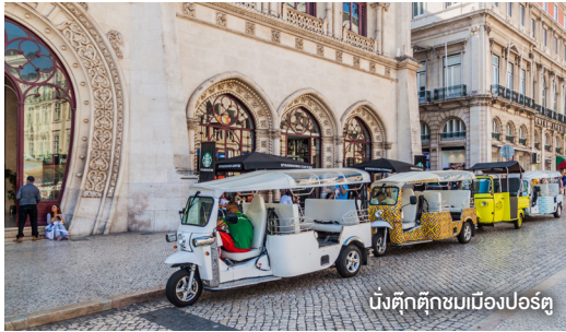
มิ่งตึกคึกขมเมืองปอร์ตุ

● ช่วงบ่าย จากนั้นพาท่านไปสัมผัสประสบการณ์สุดเอ็กซ์คลูซีฟนั่งตึกตึกคึกขมของเมืองปอร์ตุ เมืองริมแม่น้ำโดรู ลัดเลาะผ่านย่านประวัติศาสตร์ ซ้ำมสะพานเหล็กอันเป็นสัญลักษณ์ของเมือง ชมวิวพาโนรามาที่งดงามของเมืองปอร์ตุ และบรรยากาศโรแมนติกของเมืองท่าเก่าแก่ในประวัติศาสตร์ ระหว่างทางผ่านย่านโกดังไวน์อันเลื่องชื่อ ซึ่งเป็นแหล่งปมไวน์ระดับโลกที่สืบทอดศิลปะการผลิตไวน์มายาวนาน เป็นการปิดท้าย