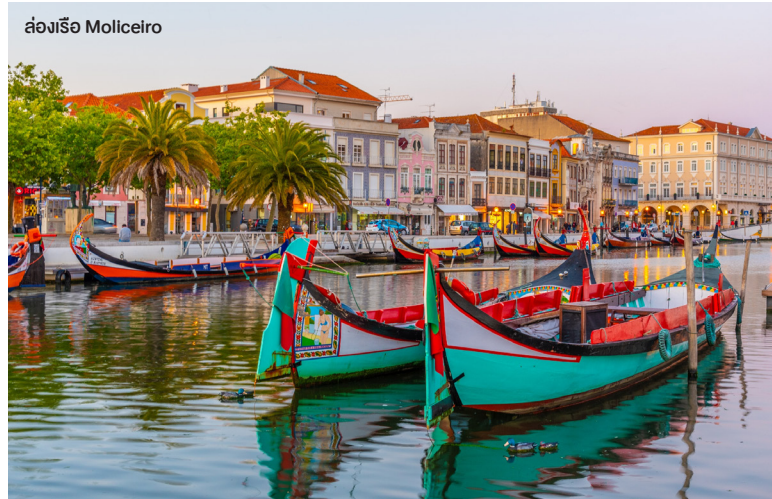
ล่องเรือ Moliceiro

หลังจากนั้นพาท่านไป ล่องเรือส่วนตัว ชมบรรยากาศโดยรอบเมืองอาไวรู เพลิดเพลินกับการล่องเรือไปตามลำคลองของเมือง ด้วยเรือ Moliceiro แบบดั้งเดิมสีสันสดใส ชมทิวทัศน์อันเป็นเอกลักษณ์ของเมืองที่งดงามที่สุดแห่งหนึ่งของโปรตุเกส (ล่องเรือประมาณ 45 นาที)